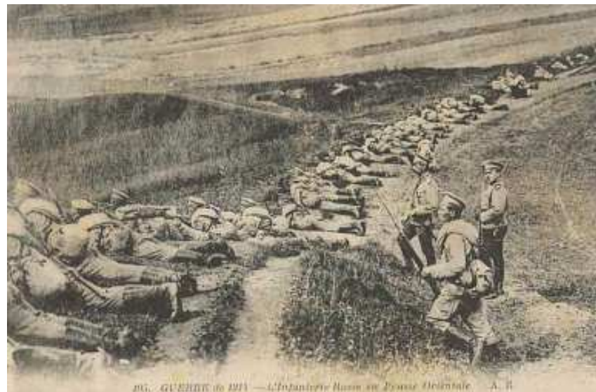
Русские войска в Восточной Пруссии под Гумбинненом. 1914