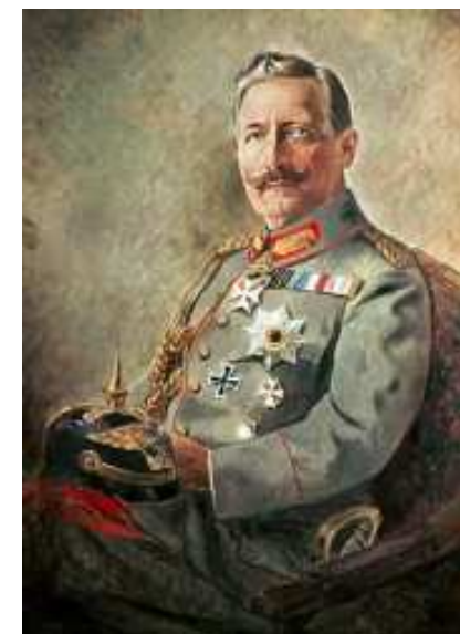
Кайзер Вильгельм II