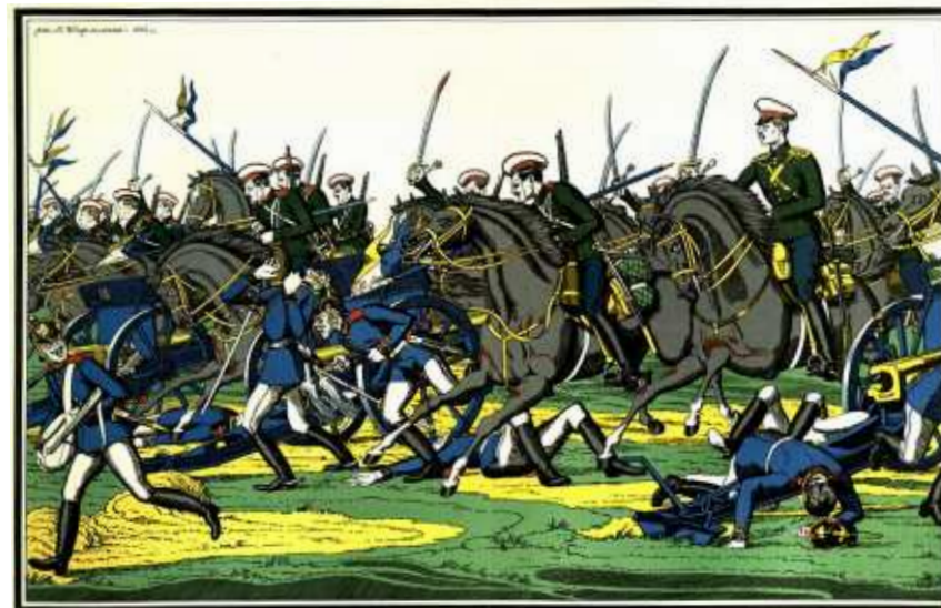
Бой при Каушене. Русский лубок

Надо сказать, что немцы воспользовались этой ошибкой в ходе сражения у Гумбиннена (7 августа), когда из-за отсутствия конницы Нахичеванского 28-я русская пехотная дивизия понесла тяжелейшие потери, а немецкие кавалеристы совершили рейд по тылам 1-й армии. Район, куда отвел войска Хан Нахичеванский, странен: пауза в проведении рейда в тыл противника —