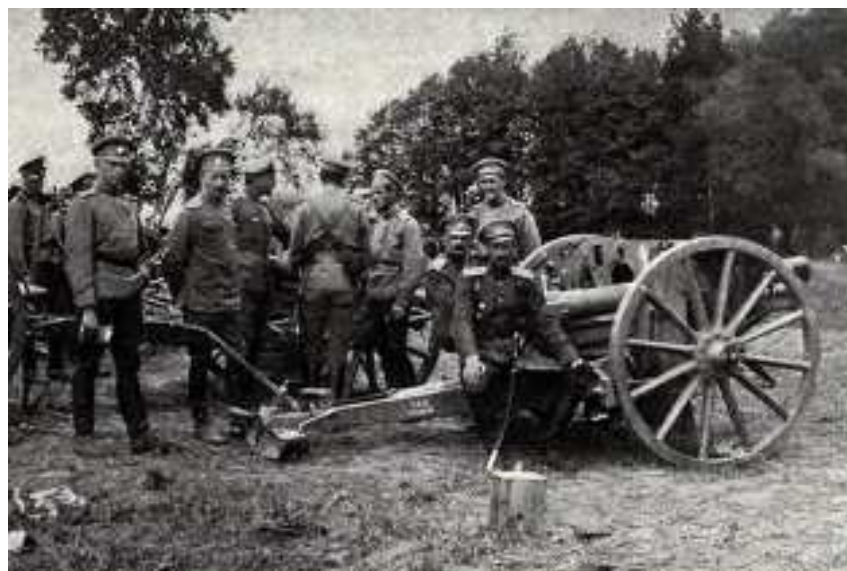
После боя у деревни Каушен. Ротмистр Врангель сидит на трофейном орудии.