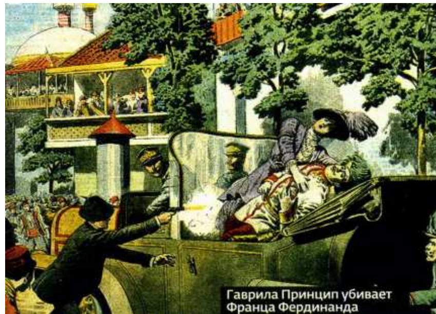
Гаврила Принцип убивает Франца Фердинанда

Планы эти с течением времени и изменением геополитической ситуации в мире менялись. До 1911 года Россия в случае войны с Германской империей склонялась к оборонительным операциям на её первом этапе. Русское командование учитывало, что Германия от-